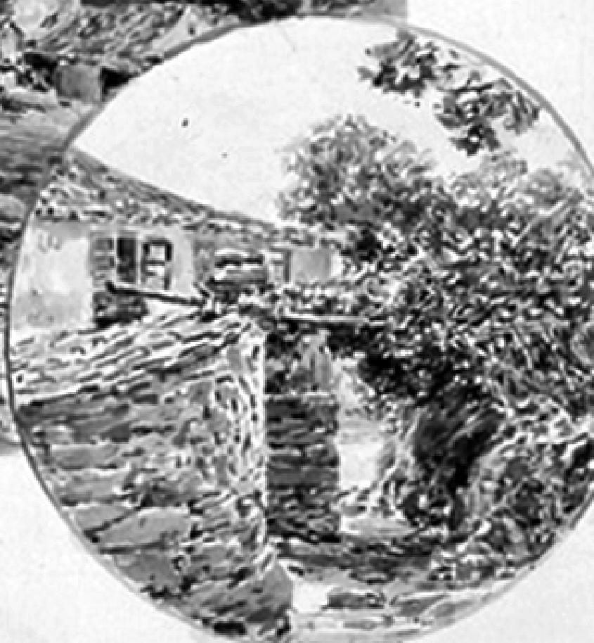
ISLA DE CORTEGADA "LA ALPEA" "UN RINCON"

dejando el botido dentro el rancho de la casa del piloto de la zona el 24 de octubre el rancho del piloto de la zona