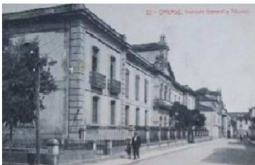
Instituto General Técnico (Foto antigua)