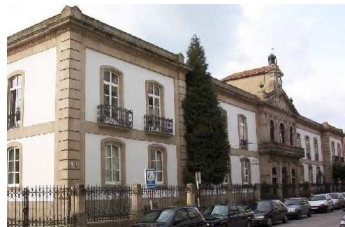
Instituto Otero Pedrayo (Foto moderna)